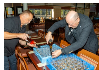
Upphållningsgruppen en viktig kugge i genomförandet