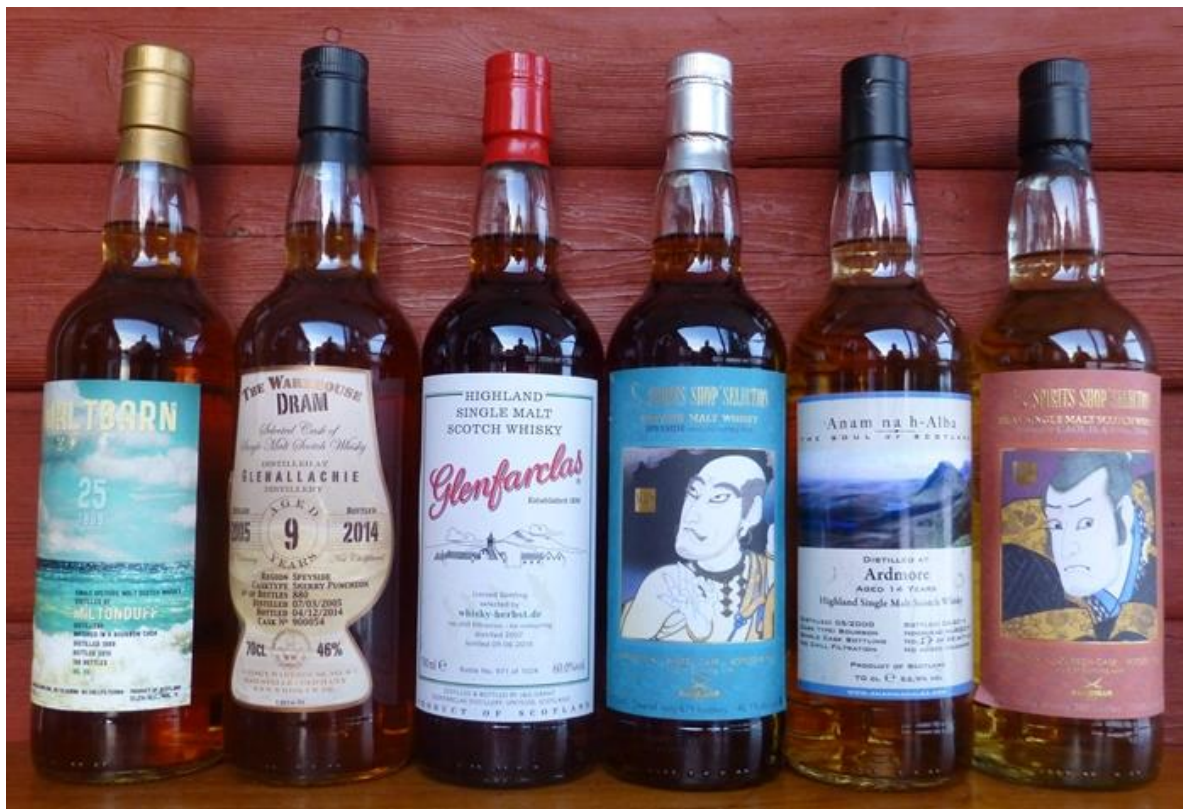
Kvällens provade flaskor på parad.

Kvällens bästa whisky röstades fram genom handuppräckning. Man röstar på vilket glas som deltagarna anser kommer på 1:a, 2:a och 3:e plats. Rösterna viktas sedan så att en röst för första platsen ger 3 poäng, en andra plats ger 2 poäng och tredje ger 1 poäng. Vinnare är den whisky som får flest poäng totalt.