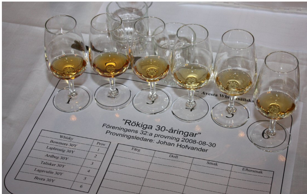
Upphållda och redo för avsmakning

Detta var en öppen provning där deltagarna fick veta vad som fanns i respektive glas.