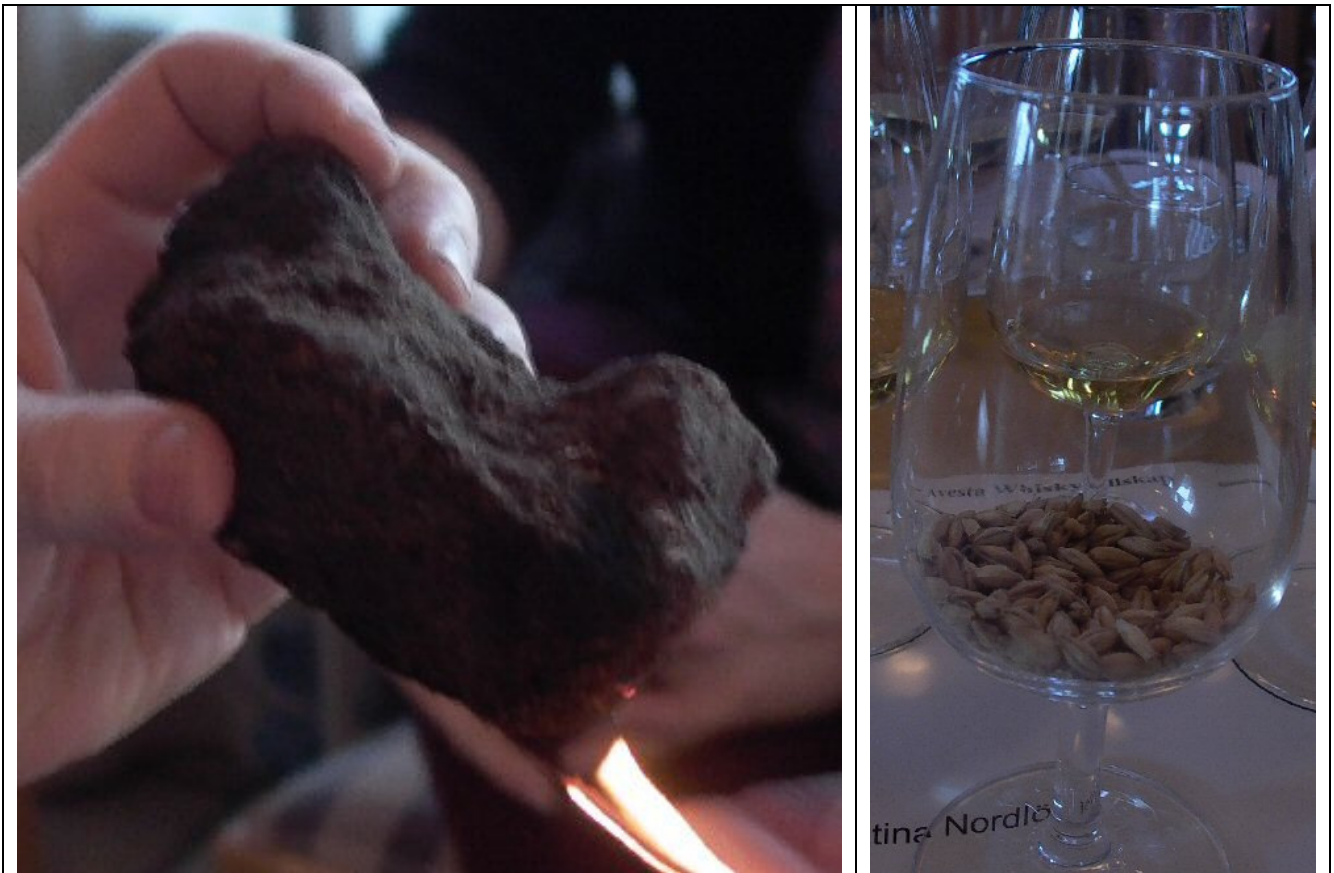
Rökig torv och rökigt korn

Man tar numera all malt från Port Ellen Maltings. Man mäter ju rökigheten hos malten som används i ppm (part per million) och hon kunde berätta att Ardbeg har en ppm halt på 58 medan övriga destillerier på Islay normalt ligger lägre, exempelvis Laphroaig och Lagavulin ligger kring 45 och Bowmore och Caol Ila ligger kring 35-45.