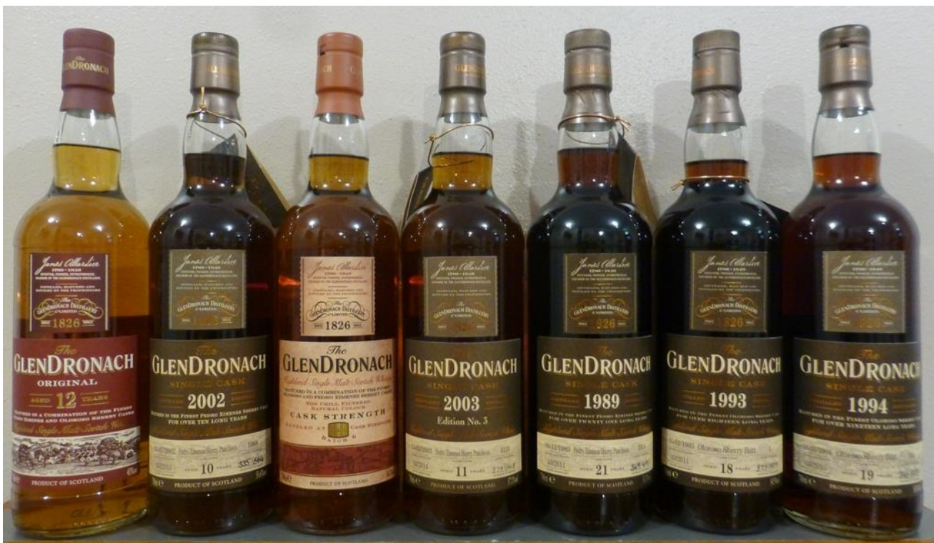
Provningens flaskor uppställda på rad