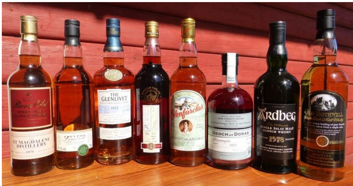
Provningens flaskor uppställda i vårsolen