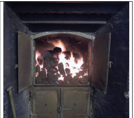
Hela gänget framför Glengyle och torveldning på Laphroaig