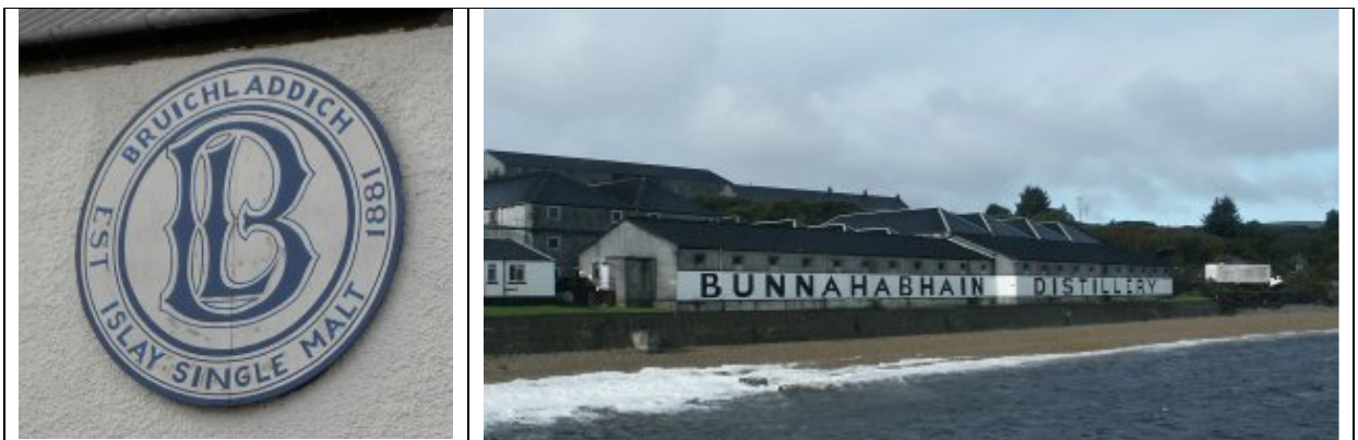
Briuchladdich och Bunnahabhain

Här följer en del av bilderna som visades under provningen (utan någon speciell ordning):