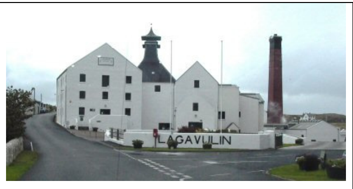
Ardbeg och Lagavulin