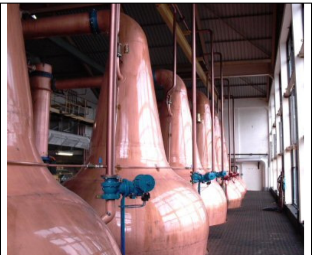
Golvmältning hos Laphroaig och Pannor hos Caol Ila