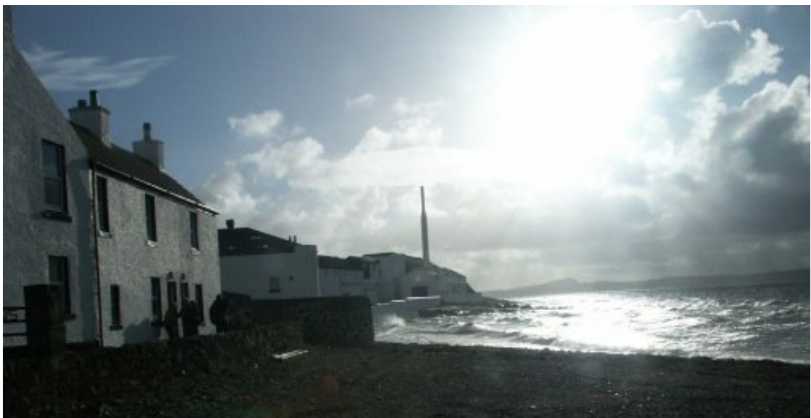
Vårt boendet i Bowmore – med destilleriet i bakgrunden