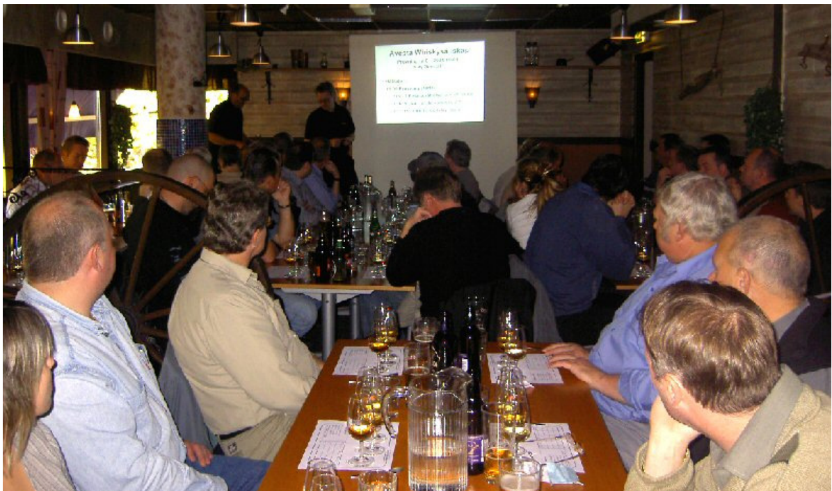
Bildvisning på Grand

Sedan var det dags för provning med reseberättelse. Det som var nytt den här gången var att provningen var helt öppen, d v s deltagarna känner från början till vilken whisky som är vilken. Detta för att man skulle kunna smaka av varje whisky i samband med berättelsen kring respektive destilleri.